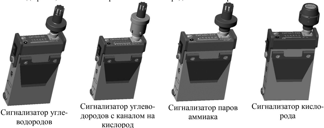
Рис.1. Модификации сигнализаторов "Сигнал-02".

Модификации сигнализаторов "Сигнал-02" представлены на рис.1.