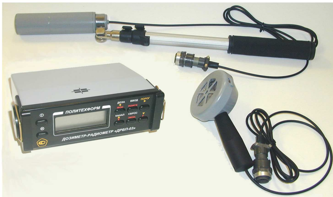
Рисунок 1 - Внешний вид дозиметра с блоками детектирования и штангой

Дозиметр комплектуется удлинительной штангой и блоком зарядки аккумулятора. Внешний вид дозиметра и места пломбировки приведены на рисунках 1 и 2.