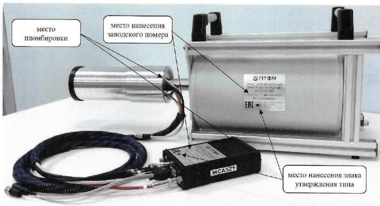
Рисунок 1 – Общий вид MKS-01PTFM с указанием мест пломбировки, мест нанесения знака утверждения типа, заводского номера